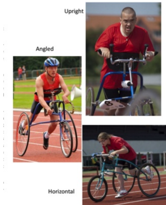
Figuur 25 RaceRunner posities.

Hoe meer gewicht er komt op de borst hoe moeilijker het ademen zal gaan.