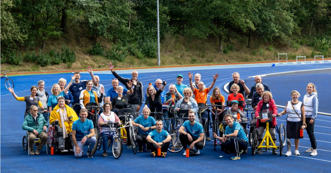
Deelnemers aan de Frame Running clinic tijdens het Run&Roll event op Papendal.

Om revalidanten en zorgprofessionals kennis te laten maken met Frame Running hebben wij clinics gegeven bij revalidatiecentra Vogellanden in Zwolle (16 maart 2023), Adelante in Hoensbroek (17 april 2023) en Basalt in Leiden (11 mei 2023). Tijdens deze clinics was er ook altijd een volwassen Frame Running atleet aanwezig als ervaringsdeskundige. Na afloop kregen alle deelnemers een flyer met daarop de verenigingen in hun omgeving waar zij aan Frame Running kunnen gaan doen. Vanuit deze clinics zijn er volwassen revalidanten doorgestroomd naar een atletiekvereniging in hun regio om aan Frame Running te gaan doen.