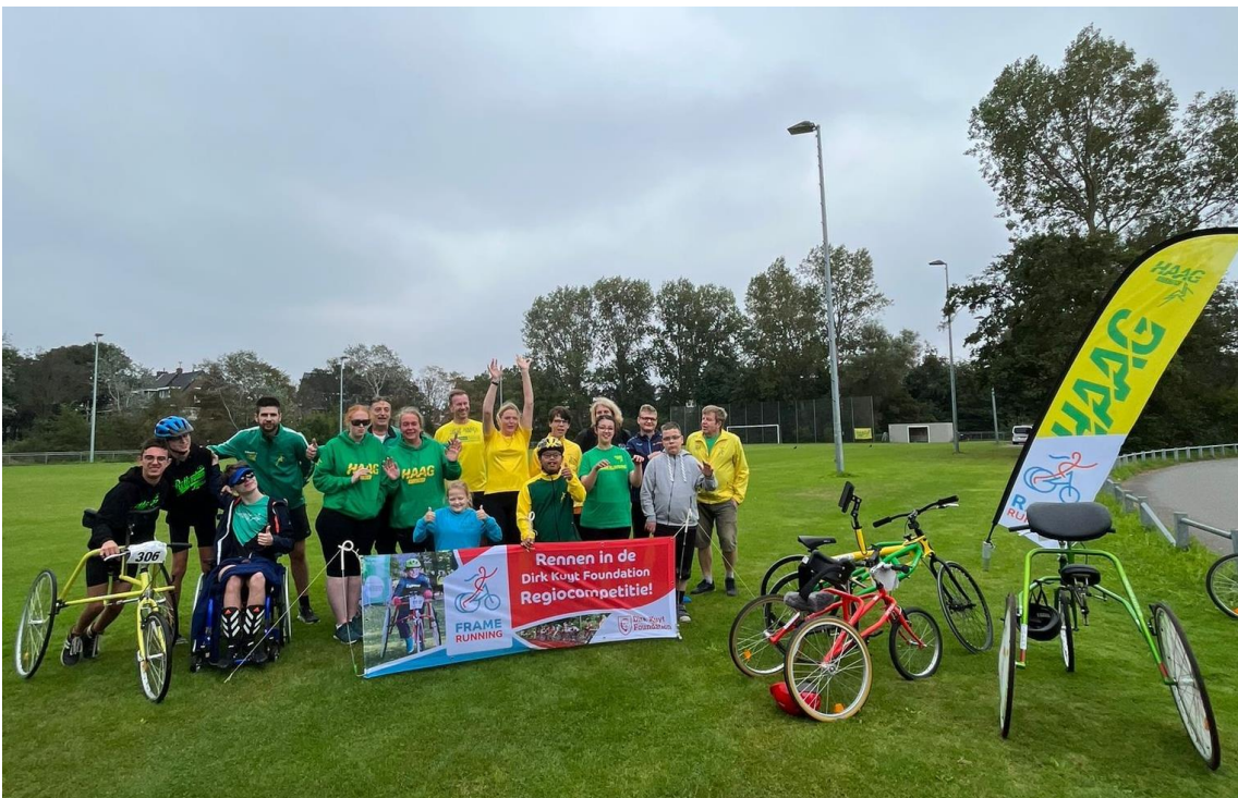
Deelnemers aan de regiocompetitie in Den Haag

In 2023 zijn er vier wedstrijden georganiseerd in Den Haag, Etten-Leur, Hoorn en Nijmegen. Alle wedstrijden werden primair georganiseerd voor verenigingen in de eigen regio, maar atleten uit andere regio's mochten ook aan elke wedstrijd meedoen. Helaas is het niet gelukt om in alle 7 regio's een wedstrijd te organiseren. We hopen dat in 2024 wél alle 7 regio's minimaal 1 wedstrijd organiseren.